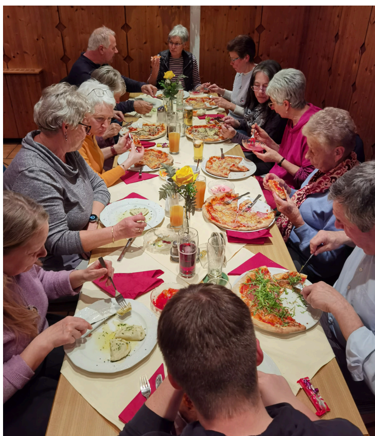
Text und Fotos: Dorfservice

Persönlich: Mittwoch von 09:00 Uhr bis 12:00 Uhr im Gemeindeamt Berg Nach telefonischer Vereinbarung ist auch ein Hausbesuch möglich!