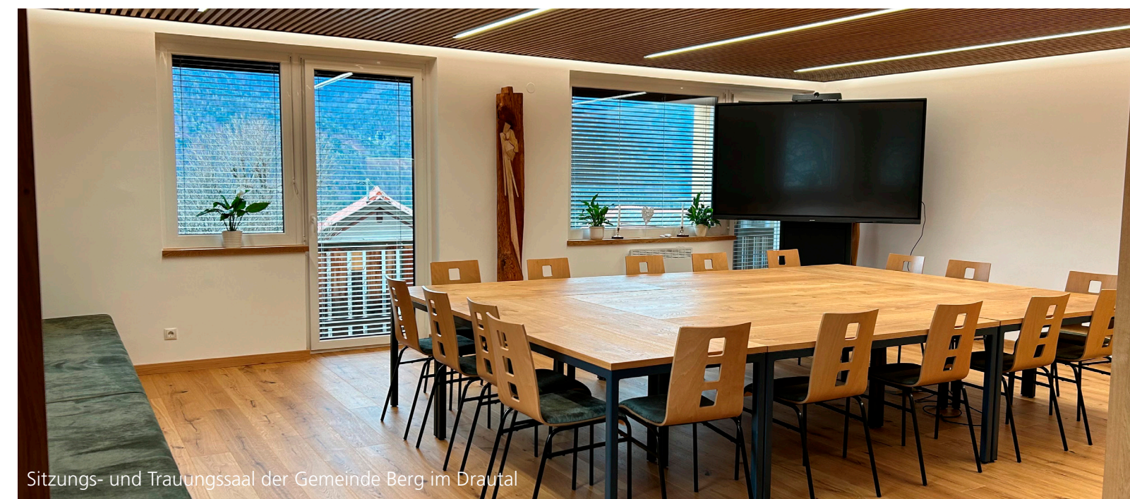
Sitzungs- und Trauungssaal der Gemeinde Berg im Drautal