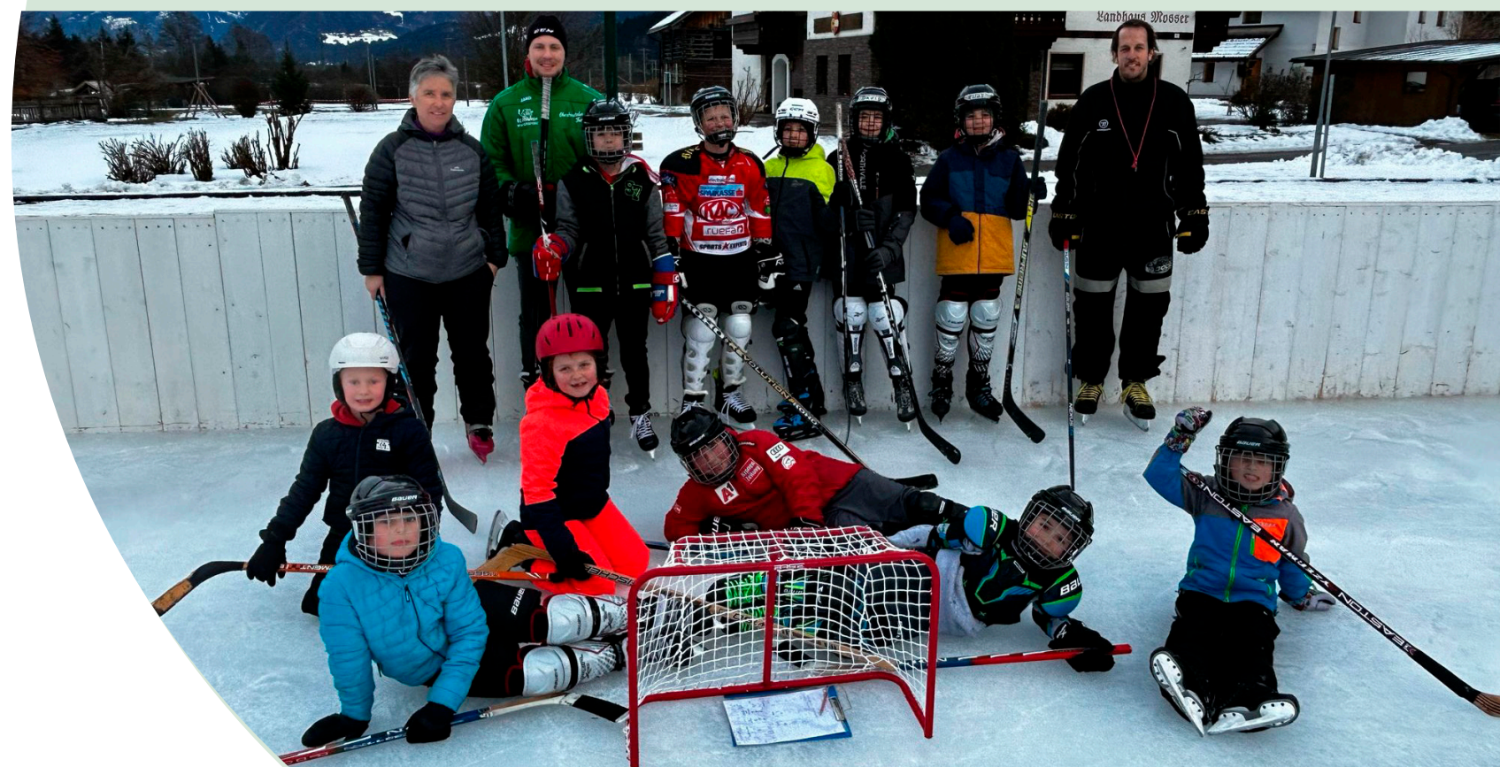
Text und Fotos: Rainer Thalmann