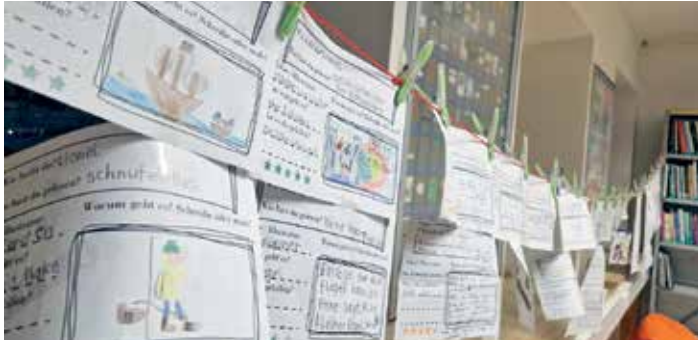
Die eingereichten Buchsteckbriefe.

Das Jahr neigt sich dem Ende zu, die dunkle Jahreszeit hat begonnen und damit auch die Zeit des Lesens und Vorlesens. Gleichzeitig ist es wieder Zeit, Bilanz zu ziehen und das vergangene Jahr Revue passieren zu lassen.