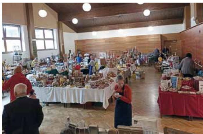
Text und Fotos: Slow Food Gemeinschaft Berg